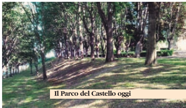
Il Parco del Castello oggi