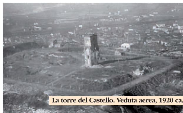
La torre del Castello. Veduta aerea, 1920 ca.

Nell'ottica di sopperire a tale carenza, la Fondazione ha deciso di intervenire direttamente nella cura di tale polmone verde attraverso la stipula con il Comune di Tortona di una convenzione per il 2012 che prevede la realizzazione delle opere di manutenzione ordinaria che hanno riguardato l'intera area attraverso la periodica sfalcatura dei prati, la potatura delle siepi e di alcune essenze nelle vicinanze della torre del Castello e la pulizia delle rive. Un segnale di attenzione del nostro Ente, nella speranza che questo impegno dia impulso ad iniziative finalizzate alla realizzazione di quelle infrastrutture che consentano alla città di riappropriarsi di un'area intimamente legata alla storia, alla vita ed alle tradizioni di Tortona.